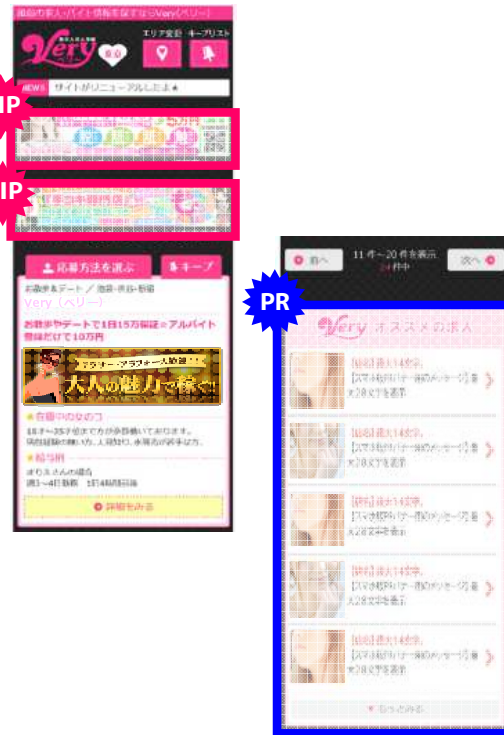
スマホ版 検索一覧ページ