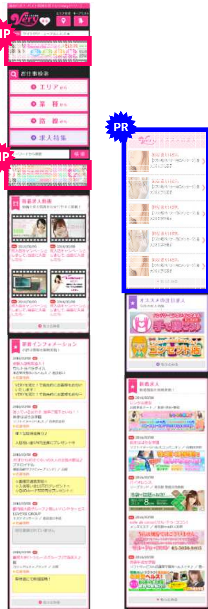
スマホ版 トップページ